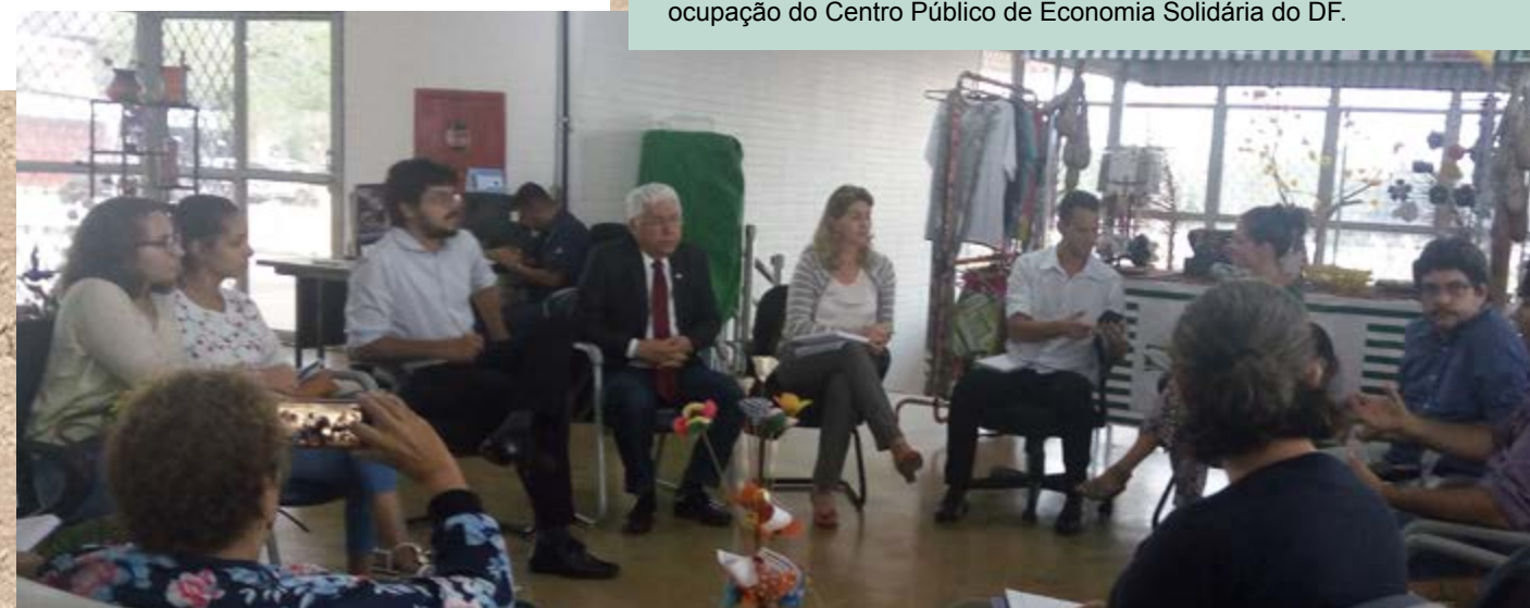
Equipe da Secretaria de Trabalho do GDF e representantes do Fórum de Economia Solidária do DF e Entorno (FESDFE) em reunião sobre a ocupação do Centro Público de Economia Solidária do DF.

2) O subsolo do Centro Público de Economia Solidária do DF foi inteiramente entregue à nova Secretaria de Atendimento à Comunidade criada pelo GDF, frustrando os planos de ocupação do espaço que vinham sendo dialogados entre a equipe da Secretaria de Trabalho do GDF e representantes do Fórum de Economia Solidária do DF e Entorno (FESDFE), especialmente nos meses de março e abril/19.